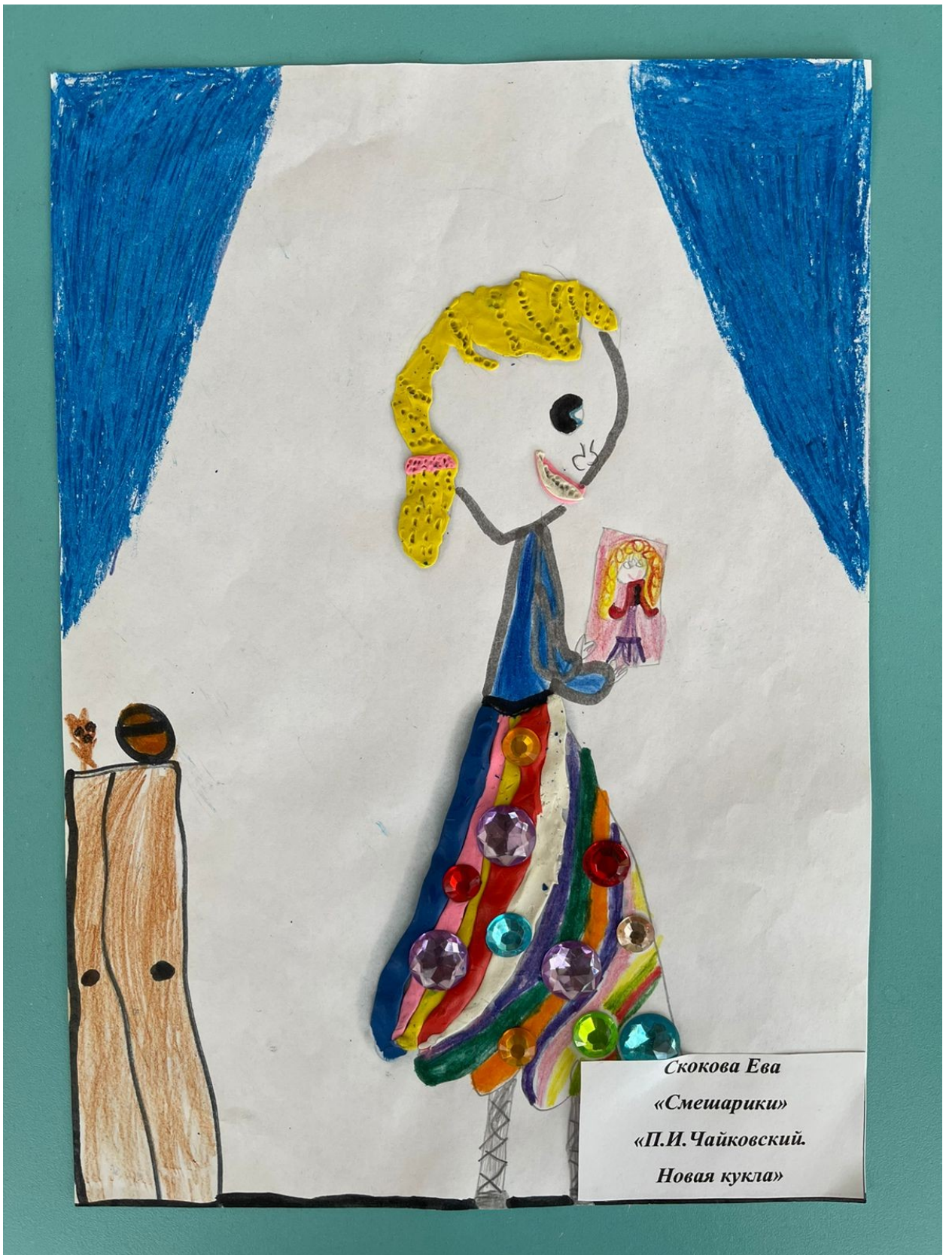
Скокова Ева «Смешарики» «П.И. Чайковский. Новая кукла»