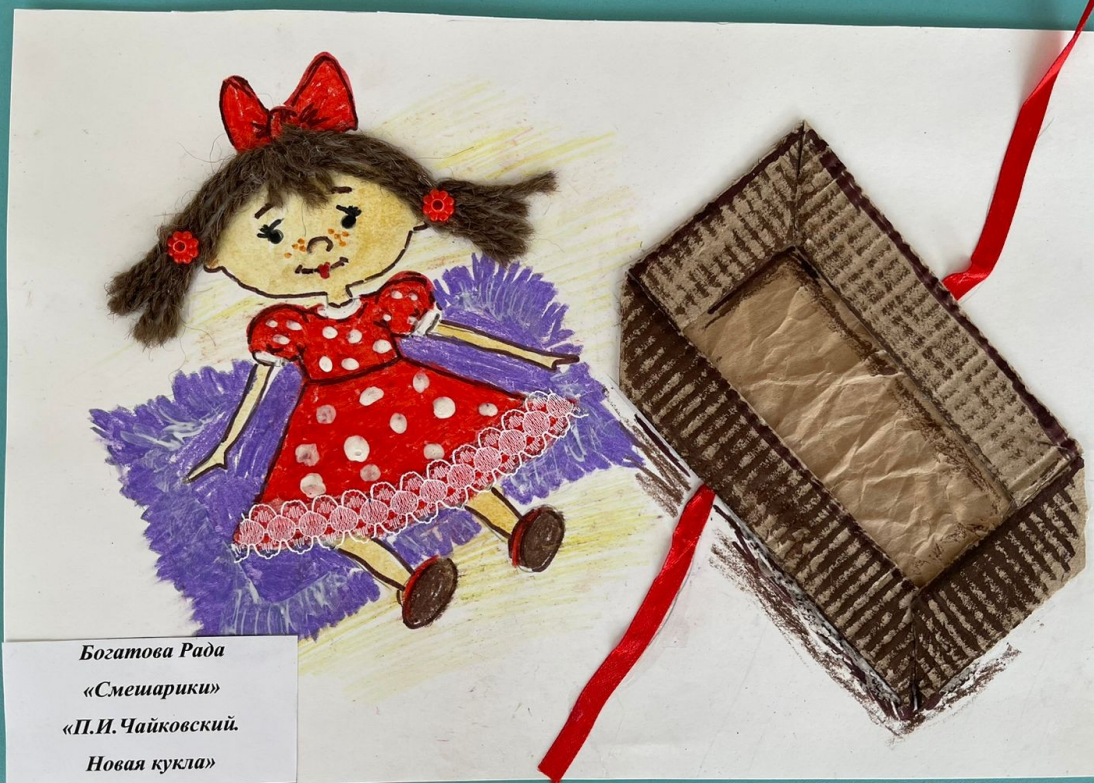
Богатова Рада «Смешарики» «П.И. Чайковский» Новая кукла»